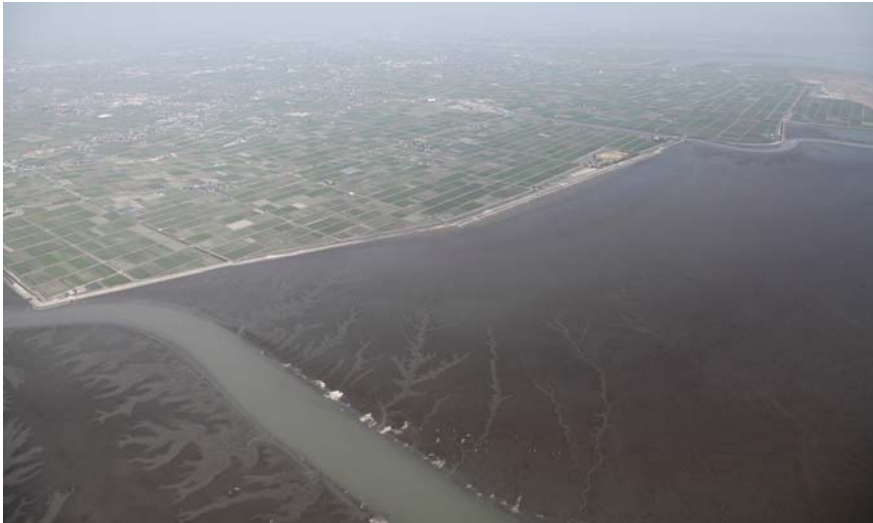
南西からみた東よか干潟全景