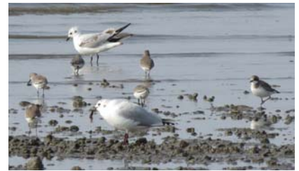
ズグロカモメ

とその後方に広がる干潟が一望でき、また、海岸線沿いの遊歩道からは、引き潮のときには無数のカニやムツゴロウ、トビハゼなどが観察できる。春・秋の渡りの時期に、数千羽のシギやチドリが干潟めがけて飛んできて、一心不乱に餌をついばむ姿は壮観である。