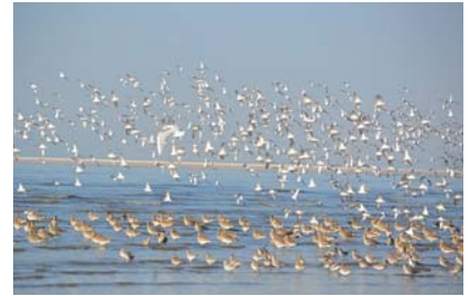
シギ・チドリ類の重要な中継地